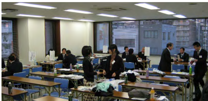
写真は昨年実施した留学情報研究ゼミナール